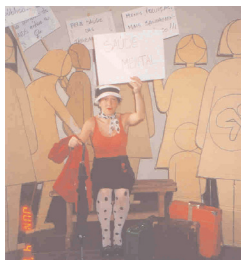
Fotos do curso de preparação do mutirão.