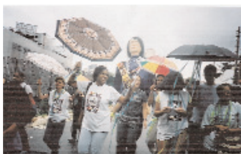
Bloco carnavalesco Casa da Dona Yayá, 2004.

Assim como a Casa de Dona Yayá localizada no Bexiga- Bela Vista – patrimônio tombado pelo Condephat, principalmente requerido por uma historiadora que presenciou este fato quando menina. Onde uma mulher por nome Dona Yayá foi mantida presa por 42 anos numa casa, adquirida com sua herança, que funcionou como um hospício particular onde a mão da medicina no caso a psiquiatra e os engenheiros, construíram um espaço de opressão para enclausurá-la. No caso o psiquiatra o famoso Franco da Rocha. Aqui apresentamos as alterações arquitetônicas executadas para que garantissem sua prisão.