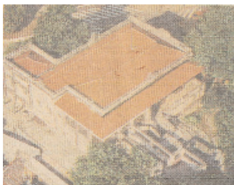
Casa da Dona Yayá.

Maria Amélia Azevedo, psicóloga, e profesora no Instituto de psicologia da Universidade de São Paulo, em seu livro Mulheres espancadas , quando discute que a ideologia patriarcal e machista perpassa e permeia todo o tecido social vem contribuir, para que nós arquitetas/os, aumentemos nossa percepção e reflexão em relação a esta questão. Na página deste livro apresenta um debate acontecido no Jornal do Brasil , RJ, na década de 80, quando uma socióloga encaminha uma crítica contundente ao ver, publicado numa das sessões de serviços, a sugestão de arquitetura de interiores para um quarto de menina e outro de menino, aqui reproduzimos os desenhos. Como vemos está tão introjetado em nossa cultura a visão sexista das funções dadas as mulheres e aos homens, do qual podemos afirmar e reafirmar sugestões de comportamento por meio da arquitetura de interiores. O quarto da menina, cor de rosa claro, com corações e significados românticos e o privado sendo relevado, e o do menino uma estação de trem fortalecendo o espaço público e da criatividade da produção e da circulação, do engenho. No nosso entendimento o quarto da menina pode conter os dois mundos assim como o do menino. Ver ilustração na “Introdução”.